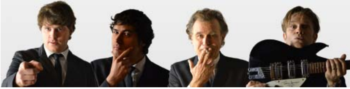
THE BEATLES REVIVAL BAND: ALLE KONZERTTERMINE (bitte anklicken)