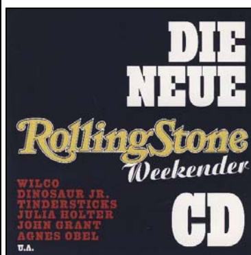
Abbildungen: Magazin mit CD ROLLING STONE WEEKENDER

Oktober 2016: Zeitschrift ROLLING STONE 264