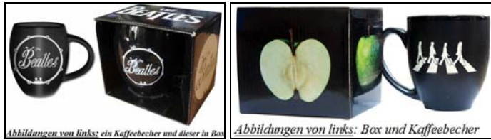
Abbildungen von links: ein Kaffebecher und dieser in Box

Format: ca. 11,0 cm hoch; Durchmesser 8,2/9,8 cm weit.