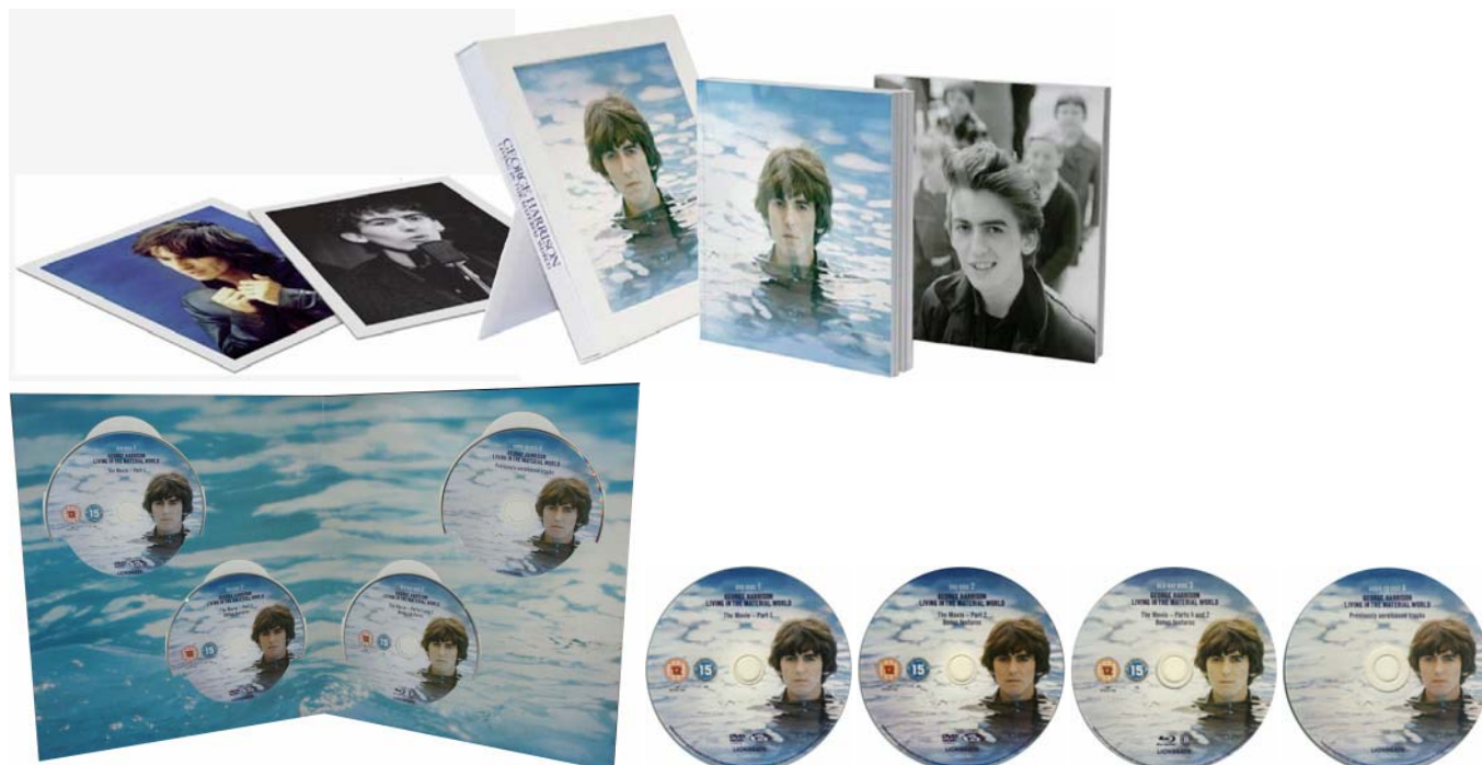
Abbildungen Deluxe Edition, vorige Seite von links: 2 Lithografien, Buch im Rahmen, das gleiche Buch; Folder für CD, DVDs und BluRay. Abbildungen Deluxe Edition, oben von links: Folder-Innenseiten mit CD, DVDs und BluRay; 2 DVDs, BluRay und CD.

Die Musikindustrie hat noch nicht gelernt, dass jemand, der so viel Geld für ein Produkt ausgibt, gerne noch ein wenig drauflegt, wenn Liebe zum Produkt erkennbar und die Verarbeitung bestens ist. Das ist bei dieser Box leider nicht der Fall.