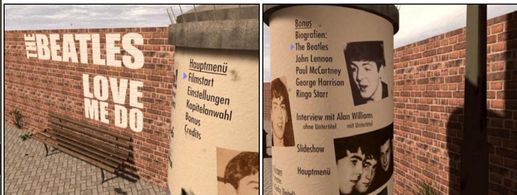
Abbildungen: DVD-Cover; zwei Menue-Abbildungen