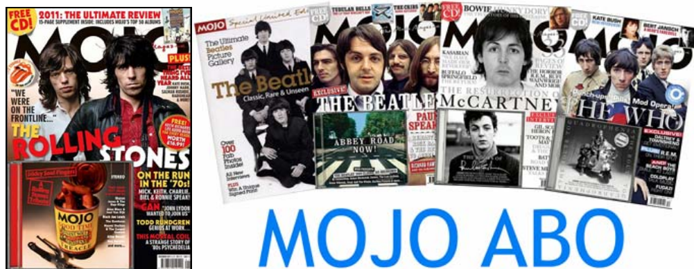
Abbildungen: von links; Das aktuelle Heft für Januar 2012; danach bereits erschienene Ausgaben (meist nicht mehr lieferbar)

und würden uns freuen, wenn Du dabei bist: pro Heft 13,50 Euro & 0,85 € Versand