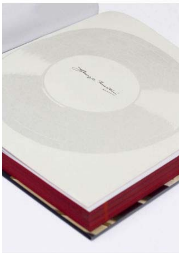
Abbildung: Das von GEORGE MARTIN signierte Buch in einer Kassette