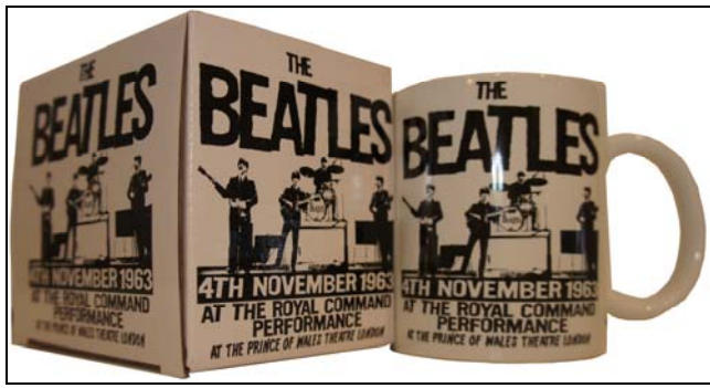
Abbildungen von links: Box und Kaffeebecher

2013: BEATLES -Kaffeebecher in Geschenkbox ROYAL COMMAND PERFORMANCE. 7,50 € ca. 9 cm hoch; ca. 8 cm Durchmesser; geeignet für Spülmaschine