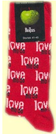
LOVE ME DO auf rot SOX05 (groß für Schuhgröße 41-45) SOX06 (klein für Schuhgröße 36-41)