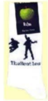
JUMPING BEATLES auf weiß SOX07 (groß für Schuhgröße 41-45) SOX08 (klein für Schuhgröße 36-41)