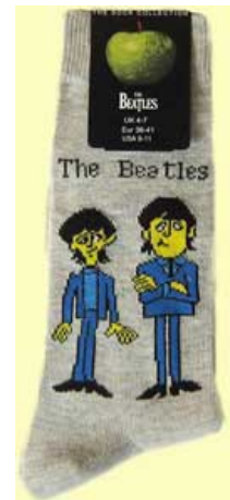
CARTOON JPG&R auf grau SOX25 (klein für Schuhgröße 36-41)