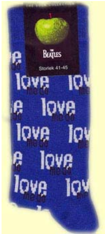
LOVE ME DO auf blau SOX03 (groß für Schuhgröße 41-45) SOX04 (klein für Schuhgröße 36-41)

Beim Kauf von 5 Paar BEATLES-Socken gibt es ein Paar BEATLES-Socken als Überraschung gratis.