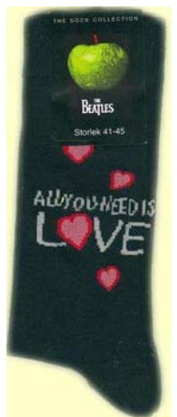
Schrift ALL YOU NEED IS LOVE auf schwarz SOX19 (groß für Schuhgröße 41-45) -