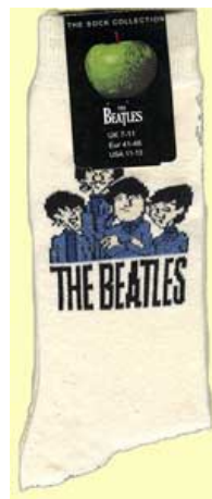
CARTOON BEATLES auf weiß SOX26 (groß für Schuhgröße 41-45) SOX27 (klein für Schuhgröße 36-41)