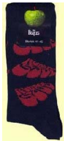
Logo RUBBER SOUL auf schwarz SOX15 (groß für Schuhgröße 41-45) SOX16 (klein für Schuhgröße 36-41)