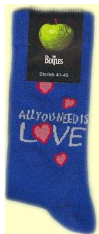
Schrift ALL YOU NEED IS LOVE auf blau SOX17 (groß für Schuhgröße 41-45) SOX18 (klein für Schuhgröße 36-41)