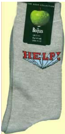
Schrift HELP! auf grau SOX34 (groß für Schuhgröße 41-46) SOX35 (klein für Schuhgröße 36-41)