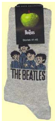
CARTOON BEATLES auf grau SOX11 (klein für Schuhgröße 36-41)