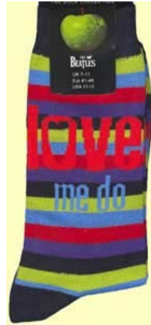
LOVE ME DO bunt SOX30 (groß für Schuhgröße 41-46) SOX31 (klein für Schuhgröße 36-41)